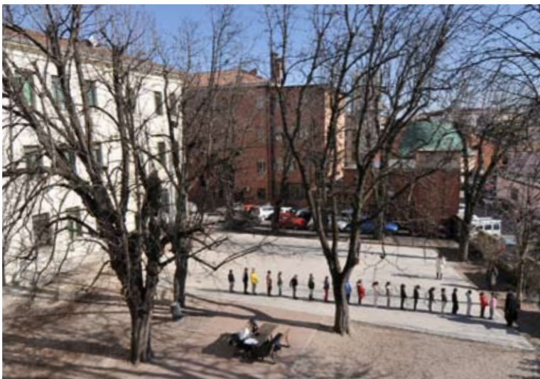
Treviso, scuola primaria Gabelli, febbraio 2009

Per informazioni: tel. 0422.5121, perlascuola@fbsr.it .