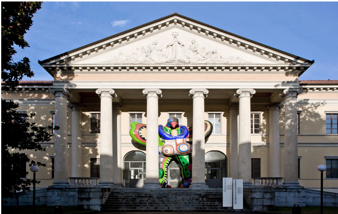
Palazzo Turconi, Campus AAM, Photo by Alberto Canepa

Dopo l'incontro con l'artista Arcangelo Sassolino sul dialogo tra arte e architettura (novembre 2020), AMA-Accademia Mendrisio Alumni , sempre in collaborazione con USI-Accademia di architettura di Mendrisio e il servizio USI Alumni, prosegue con questa iniziativa sul rapporto tra cinema e architettura il percorso di avvicinamento alle celebrazioni del 25° anno dell'Accademia , che culminerà in autunno con l'esposizione sul lavoro degli oltre 2.200 architetti diplomati all'Accademia. Il progetto culturale di AMA si compone di un programma di eventi e incontri di respiro internazionale, che rispecchiano l'esigenza di interdisciplinarietà che ha sempre caratterizzato il programma educativo dell'Accademia.