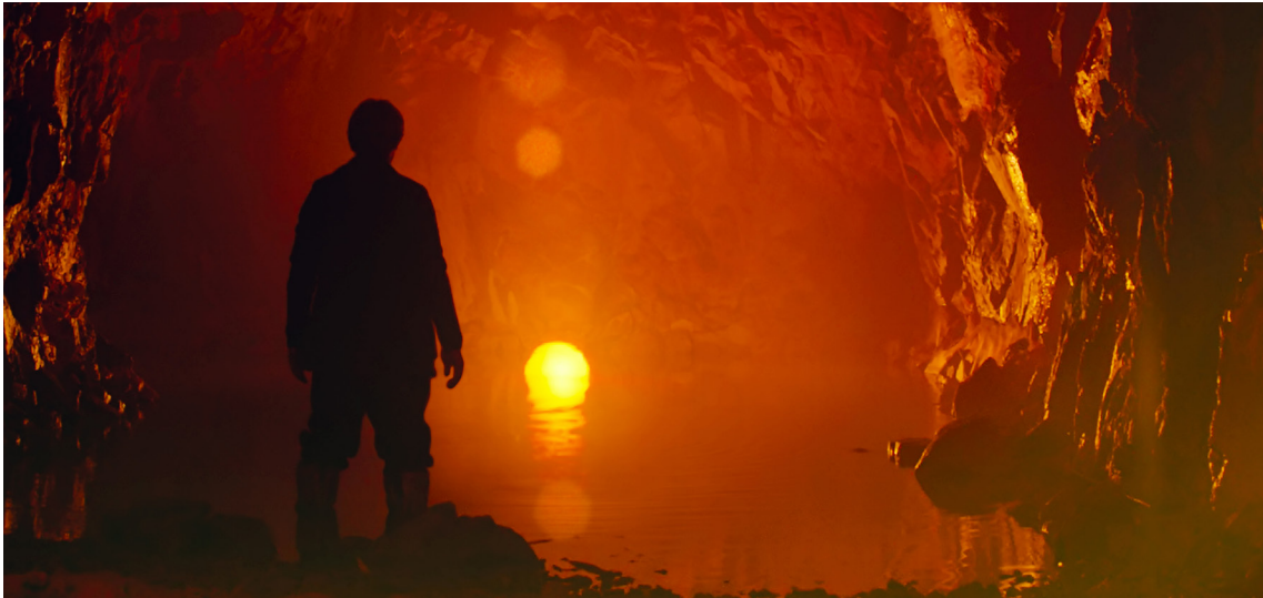
Siberia, con Willem Dafoe, 2020

Abel Ferrara: “Come ha scritto Pasolini, la migrazione verso la città fu l’inizio dell’alienazione di una classe di persone da cui è stata strappata la loro connessione con il cibo che mangiano e l’aria che respirano fino alla loro connessione spirituale con la terra, per diventare completamente un’altra razza”.