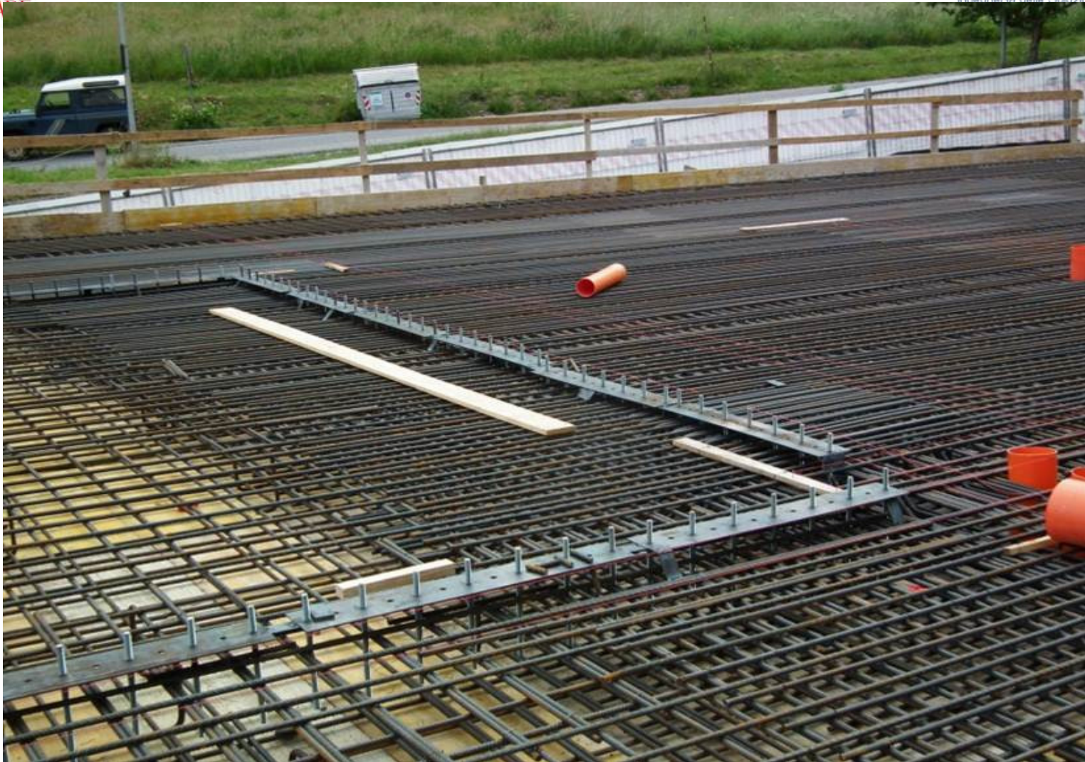
POSA IN OPERA DELLE CONNESSIONI CALCESTRUZZO-LEGNO