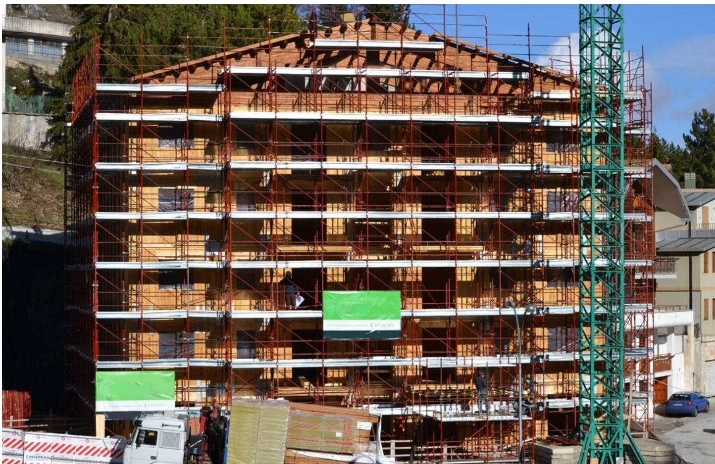
www.idsingegneria.it Alexander Residence – Roccaraso (Aq) 2012