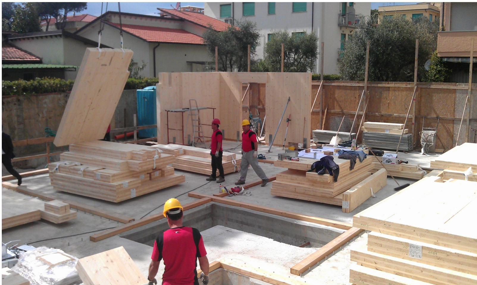
FORTE RESIDENCE – LIDO DI CAMAIORE (LU) – APRILE 2013