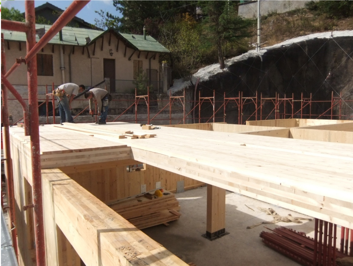
FISSAGGI SOLAIO – PANNELLO VERTICALE www.idsingegneria.it