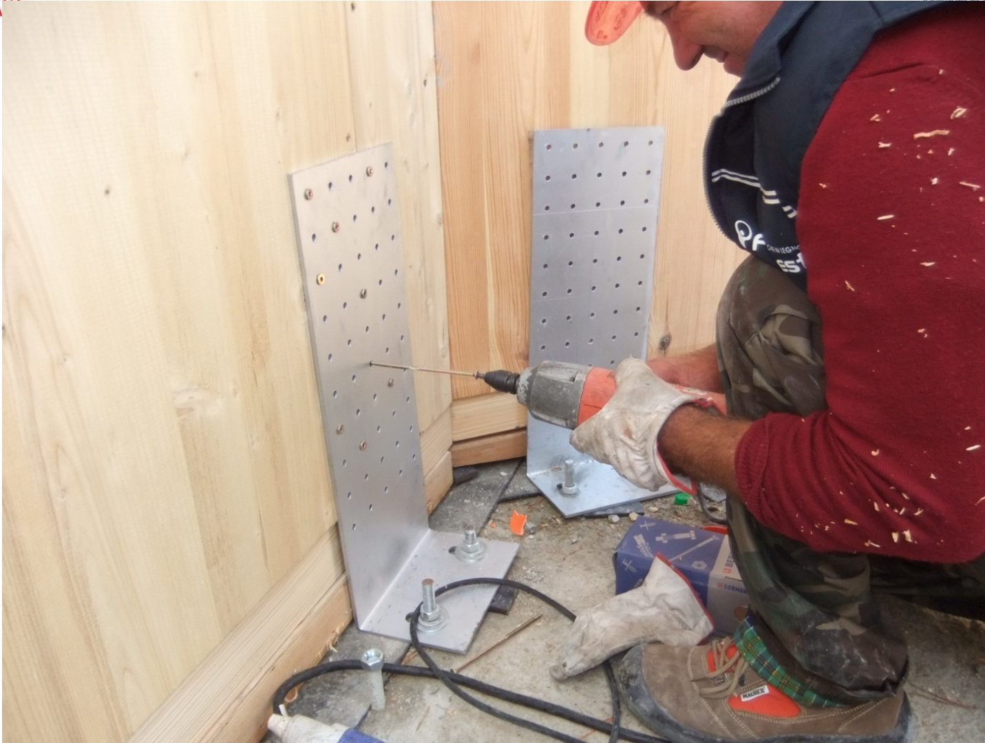
FISSAGGIO PANNELLI VERTICALI