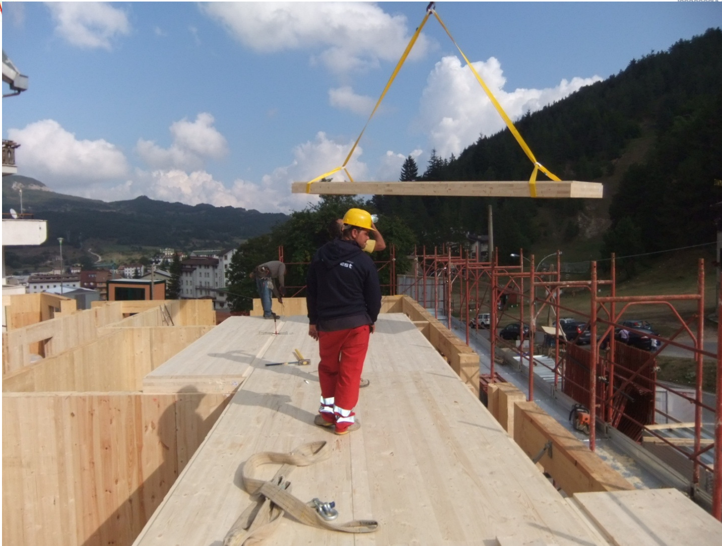
POSIZIONAMENTO DELLE LASTRE SOLAIO