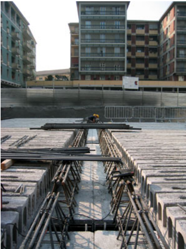
Fig. 3 - Travi reticolari accoppiate.

Tutti gli elementi strutturali presentano REI 120 (compresi i pilastri).