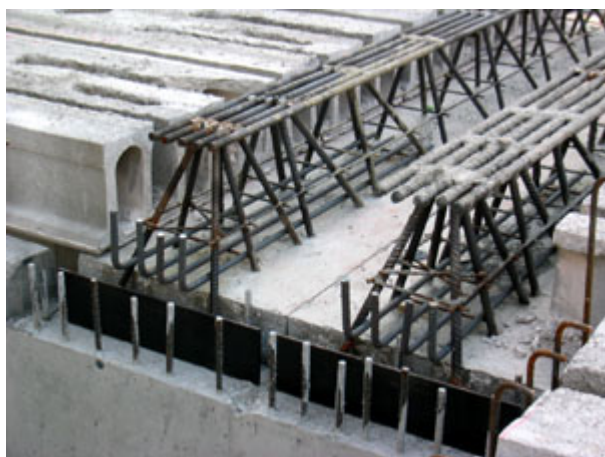
Fig. 6 - Appoggio del solaio alveolare alle travi reticolari.