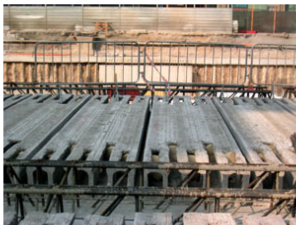
Fig. 7 - Particolare dei pannelli di solaio alveolare.