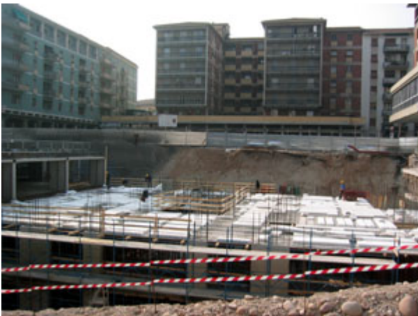
Fig. 8 - Vista del cantiere.

Per garantire la continuità del traffico veicolare l'organizzazione del cantiere e delle fasi di posa non è stata semplice.