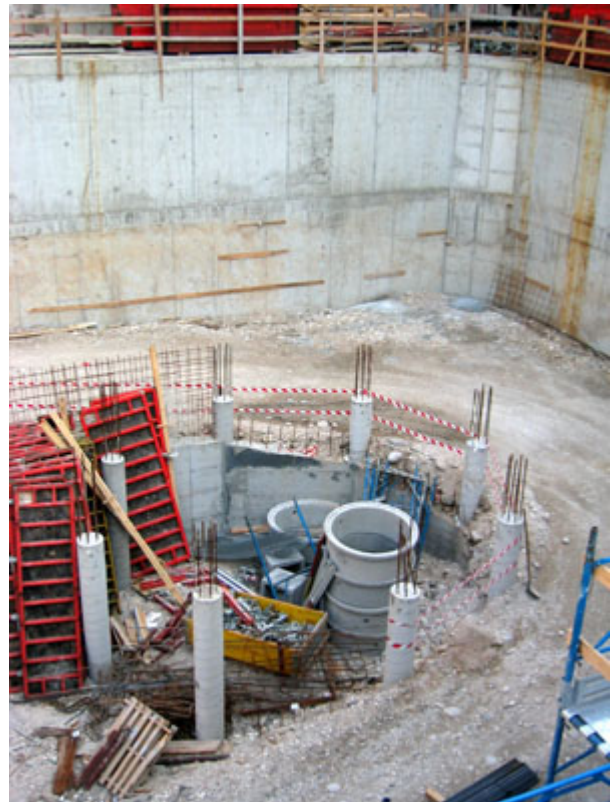
Fig. 4 - Struttura per la realizzazione della rampa di accesso al parcheggio interrato.