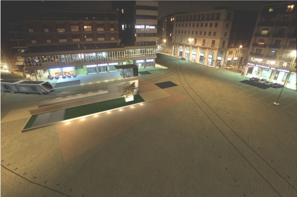
Fig. 2 - Rendering notturno della piazza a lavori ultimati.