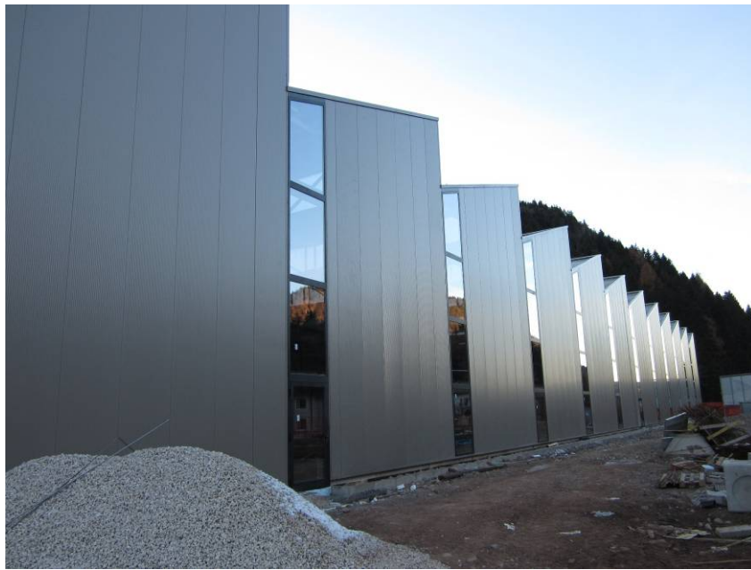
Cavalese (TN), 2012 – Sede VAP – Industria di lavorazioni meccaniche, stabilimento realizzato in carpenteria metallica.

Articolo di Ing. Monica Antinori Responsabile Ufficio Tecnico Fondazione Promozione Acciaio Via Vivaio, 11 Milano info@promozioneacciaio.it www.promozioneacciaio.it