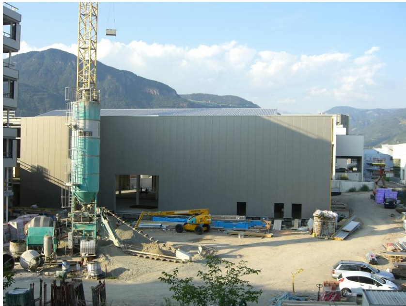
Bolzano, 2012 – Sede ATZWANGER – Industria di produzione impianti termotecnici; sede produttiva realizzata in carpenteria metallica.