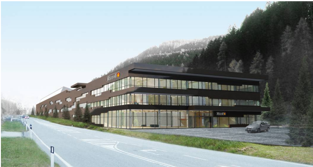
Cavalese (TN), 2012 – Sede RIZZOLI – Industria di produzione cucine, sede realizzata in strutture portanti metalliche.